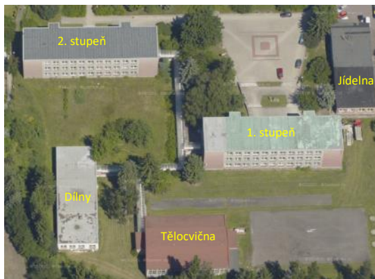
Areál základní školy Poštovní

Areál ZŠ Poštovní tvoří 5 budov (viz. obrázek) – 2 budovy 1. a 2. stupně, budova tělocvičny, budova kuchyně a jídelny a budova dílen.